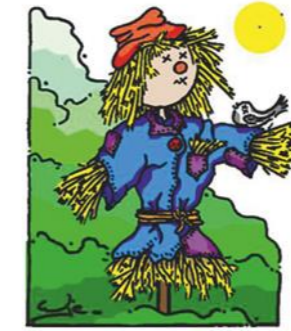
Regels voor juring