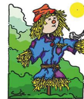
Regels voor jurering